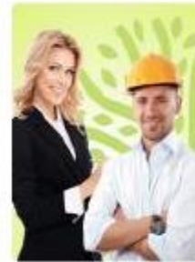
Сотрудник организации-партнера Экодиктанта

Категории отличаются по сложности вопросов: от низкой (для подростков 12-17 лет) до высокой (для экспертов, студентов, специалистов, руководителей в экологической сфере).