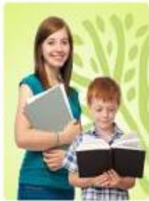
Подростки 12-17 лет