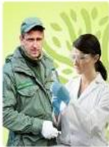
Эксперт, студент, специалист, руководитель в экологической сфере