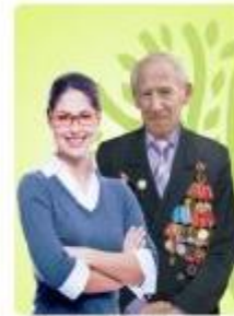
Без профильного образования возраст старше 18 лет